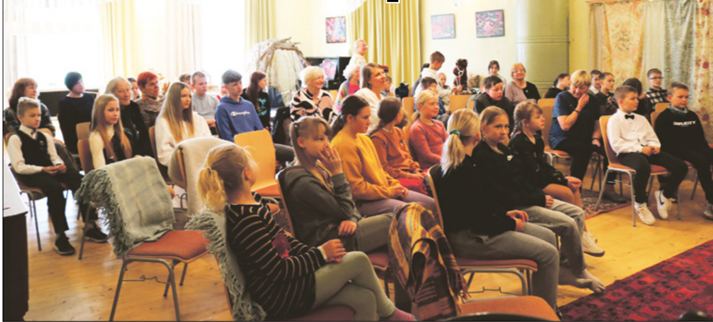
Luulõpäävast osavõtja täitsevä Sännä kultuurimõisa saali kinäste är.