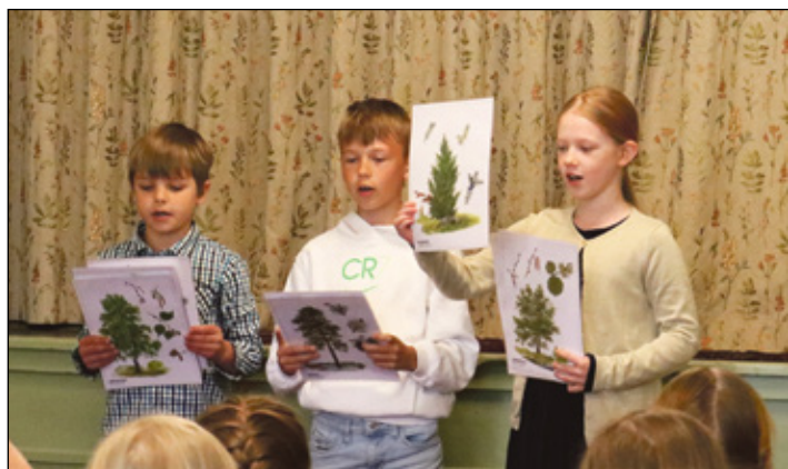
Kõgõ kavvõmba lugõja olli luulõpääväl Nõo kooli opilasõ. Näide laululinõ kava tekk tutvas mi mõtsu puid.

Luulõtuuis olli tulnu lugõma koolinoorõ Haani, Harglõ, Mõnistõ, Nõo, Orava, Põlva Jakobi, Vahtsõliina ja Võro Kreutzwaldi koolist. Lugõjidõga ütten olli luulõpi-