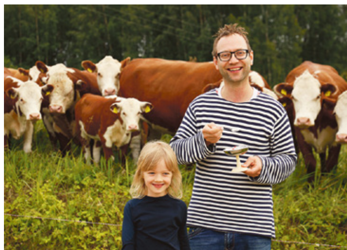
Jaan ütten tütar Sireli ja lehmiga.

Võrokõnõ om lämmä süä-mega. A uman filmin säe kõrvuisi Balkani pöörädse elo ja latsõpõlvõ Võromaa. Seo om tsipa tõdõsõ mekiga: piibupigi,