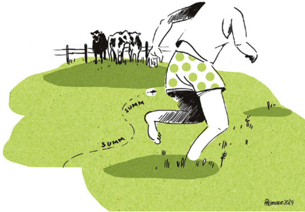
REIMANNI HILDEGARDI TSEHKENDÜS

Kafanaisiga olf kõgõ põn- nõv. Üts kässe suu vallalõ hoita ja piim juussõ kaari- ga mullõ suuhtõ. Tõsõl aviti suuri nüssükannõ vastavõtu- ruumi vitä. Vahepääl sai vas- kit nüssükuga joodõtus, hainu lehmile ette pantus, roobi- ga sitta rentsihe tõmmatus. Kõgõ miildejääjämb olf suur- tõ piimäpüttü roniminõ ja tol- lõ käsihafaga mõskminõ. Ma ei tiia, ku suur tuu olf, a ma sai vabalt püstü saista. Vooli- kuga lasti lämme vesi püttü