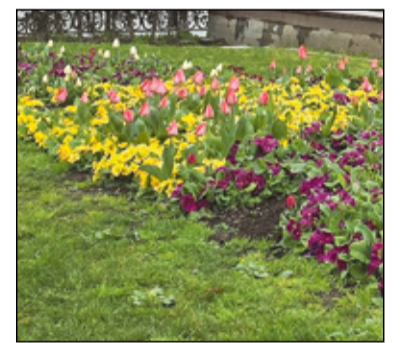
Keväjähäitsme kesk urbõkuud.

Ku kiäki Türgümaalõ trehväs, sõs mi soovitus om otsi üles sääne sann, kon käävã ka kotusõ-päälidse inemise. Säält saa nätä peris kultuuri ja peris paiklikku rahvast, ka rahha ei küstã pallo. Türgümaa inemise jäivã miilde ku väega lahkõ rahvas, kinkal om aigu suidsu kõrvälõ tiid juuva ja ilmaasju arotã. Arvada õkva tuuperäst es näe mi üttegi kuõra olõkõiga kotusõ-päälist inemist.