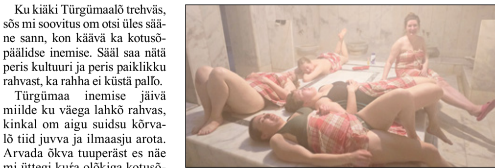
Lämmä õhuga sann hammam.