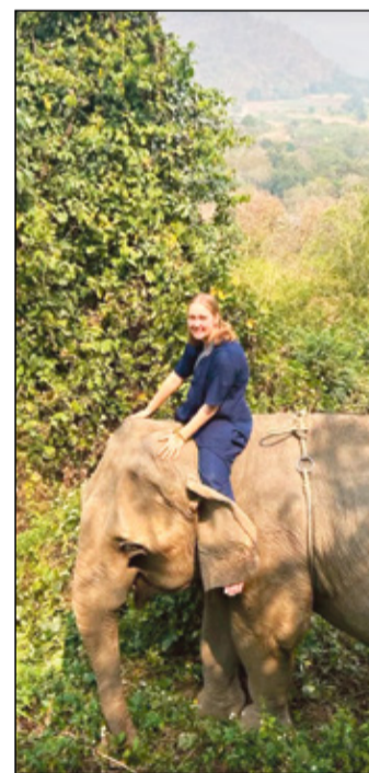
Eelevaldi sãlãh üle mãki.

Ku ma pallidõ jalgoga läbi tsungli kõndsõ ni eelevaldi