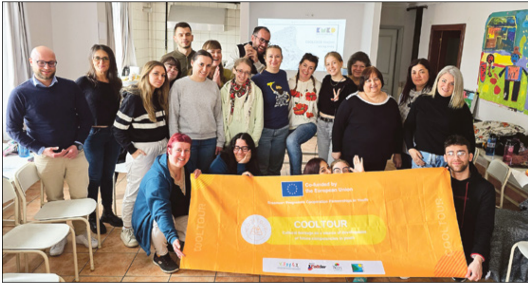
Nelä riigi noorõ ja nuuritüütäjä, mi vastavõtja, Istanbuli kultuuri ja spordi ütüsü IKOS tarõn CoolTouri plakatiiga posiirmän.