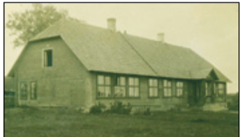
Karilatsi koolimaja, minkast sai muusõum alostusõ. Ivaski Alberti pilt 1926. aastagast.