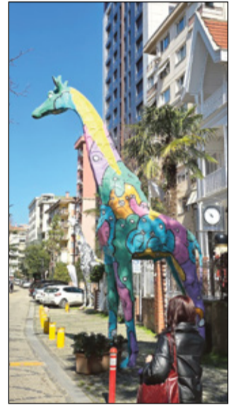
Võro kaalkirävide veli mänguasamusõumi iin.