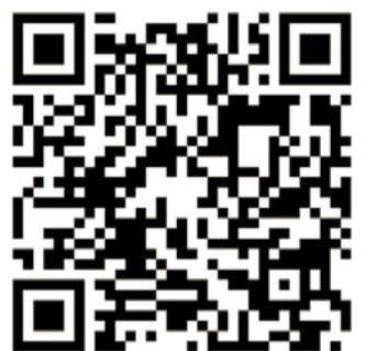
Tast lätt õkvatii video mano.