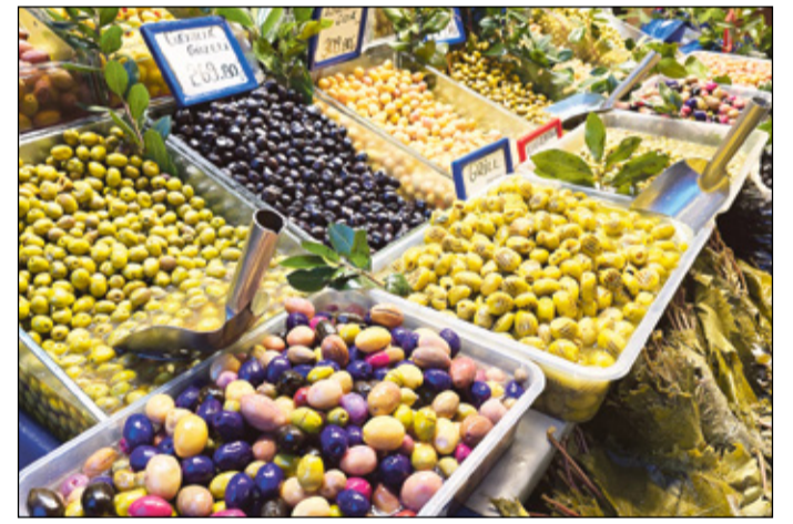
Väiku oliivivalik turu pääll.