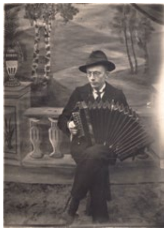
PILT OM PERI VANA-VÖROMAA KULTUURIKUA MUUSÕUMIST