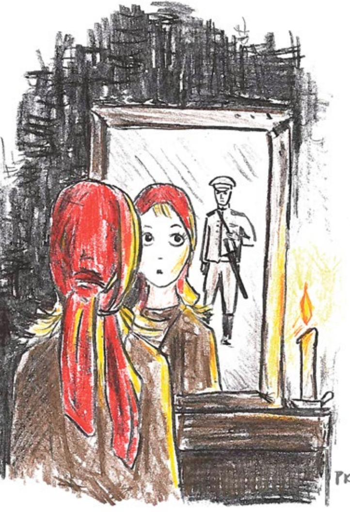
KOHA PRIIDU TSEHKENDÜS

Aasta lätsi, peigmiis pääsi kodu, tetti pulma ja kõik oll' häste, nikagu ütskõrd juhtu peremiis medägi aidast rõivakirstust otsma ja löüse säält mõõga. Nüüd tull' taal naasõga hirmudu suur pahandus. Naanõ pedi üles tunnistama, mäenest kunsti tä tütrigun tekk. Miis oll' nii pahanu, et lätt vai minemä, selle et taal oll' kroonun mõök ärä kaonu ja tedä taheti säältse suurõ essümise iist tribunali ala anda ja maha laskõ. Önnõkombõl viil anti andis, selle et taa kõik aig väega kõrralik soldat oll' ollu.