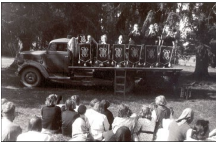
PILTI OM PERI VANA-VÕROMAA KULTUURIKUA MUUSÕUMIST