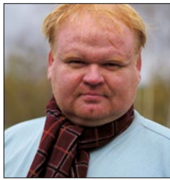
BREIDAKSI ARVED aokirānik, võrguvārehti lōunaestlane.ee kokkosāädjā

Võro ja Põlva maavanõmb omma võtnu plaani luvva katõ maakunna pääle ütine asotus, miä nakkas bussiliine kõrraldama. Tuu piäs vahtsõst aastast nakkama säädmā, kostkotsilt kohe ja mis kellāol busi sõitva.