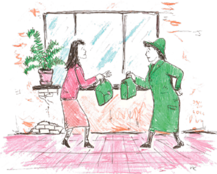
KOHA PRIIDU TSEHKENDÜS

Ütekõrra lätsi ma lõuna-vaihõl taahasamma keskliina Edu puuti. Mul oll sälän tummõt samblõrohilist värmi mäntli, ni tuuga ilosahe ansambliin säänesama rohilinõ tsumadan vai käekott. Panni poodi iinotsan tsumadani lavva pääle, õnnõ tengelpunga haari ütten, ni lätsi müügisaali kraami ostma. Tuu pääle es kulu kavva aigu, ega sis olõ-s ostminõ