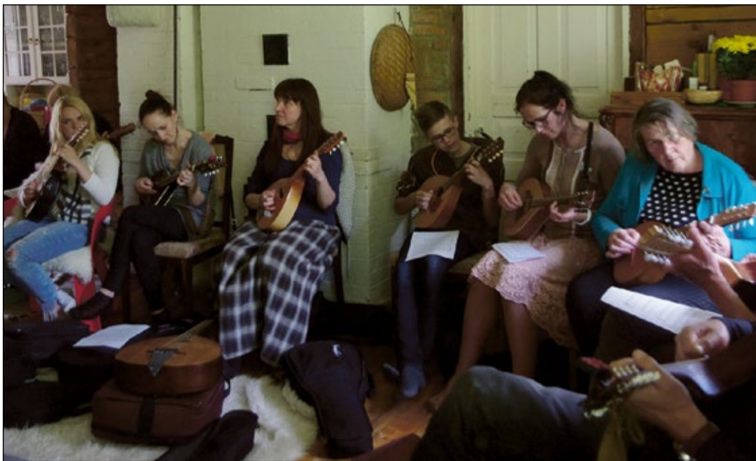
Mandoliiniopmisõl om huug seen.