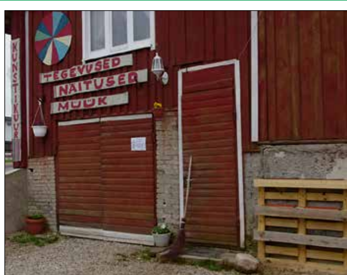
Rõugõ kunstikuur võtt luvva ussõ iist. Seo puulpäävä, 27. lehekuul tetäs Rõugõ kunstikuur suvõs valla. Kuur nakkas valla olõma egä päiv kellä 11–18.

Haridus- ja tiidüsministeeriüm ei plaani üttegi muutust opilaskododõ rahastamisõ manõ opiaastaga keskpaign. Meil omma koolipidäjiidõga lepingü 2017. aastaga lõpuni, tuu tähendäs, et opilaskododõ rahastamisõ muutusõ ei nakka kimmäle masma inne 2018/2019. opiaastat.