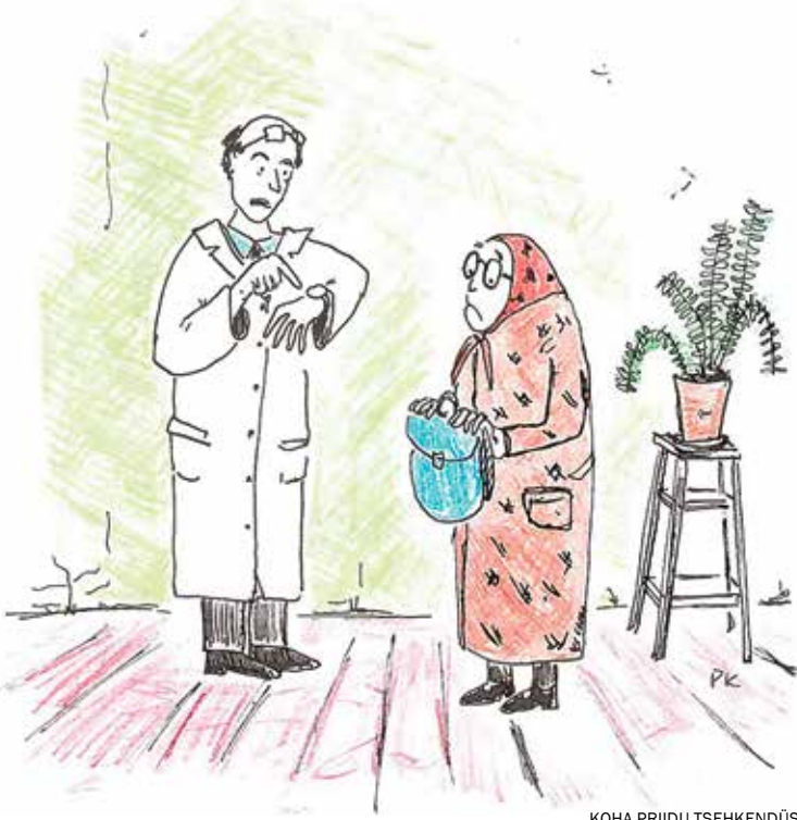
KOHA PRIIDU TSEHKENDÜS

nigu tulõjutt. Viimäte lätõ uss lakja ja edimädse sõna, midä kuulsõ, olli: «Kos ti olõti olnu, luuhõrõhusõ mõõtmisõ apar-aatki om saisma pantu.»