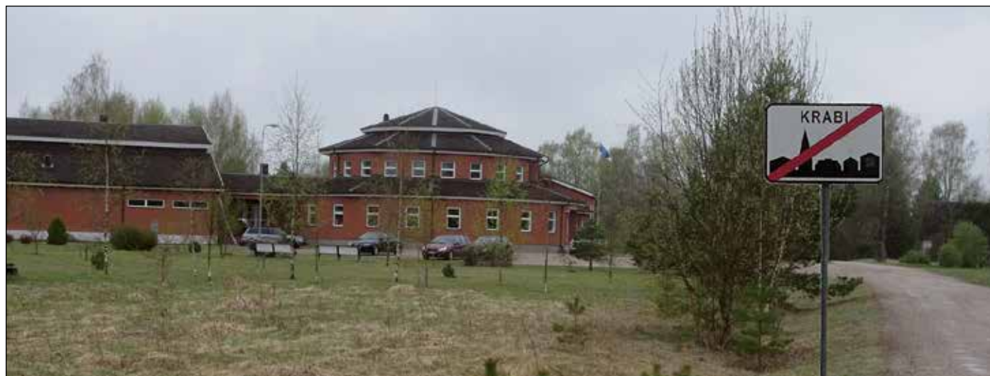
Vahtsõnõ koolimaja Krabil sai valmis 18 aasta iist. Kooli kinnipandminõ nakkas kõvastõ mõotama ka Krabi külä ello.