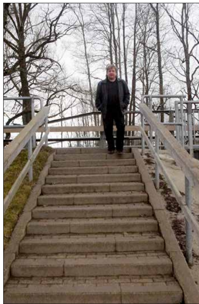
RAHMANI JANI PILT

Avvohinnas saat vastakirāga õigõ vastussõ!