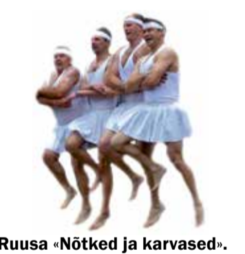
Ruusa «Nõtked ja karvased».

Tõisi siän astus üles ka Ruusa uma kaemismängutandsu kamp «Nõtked ja karvased».