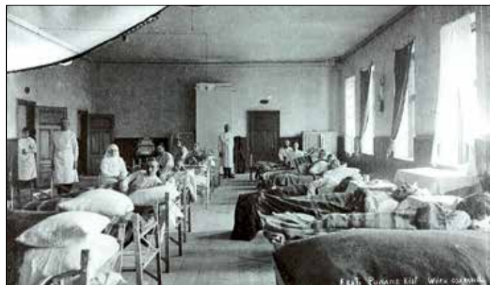
PILT OM PERI VANA-VÕROMAA KULTUURIKUIA MÜÜSÕUMIST

Ku tahat Tammõ Helele tüühobõst pakku, sõs kõlīsta 5190 9875. Hobõnõ võissi mõista nii adra ku vangõrdõ iin kävvū. Hinna üle saa kaubõlda.