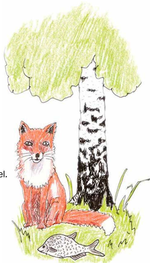
SAARÕ EVARI TSEHKENDÜS

Loe' võrokeelitsit TÄHEKEISI! www.digar.ee/arhiiv/et/periodika?id=1643