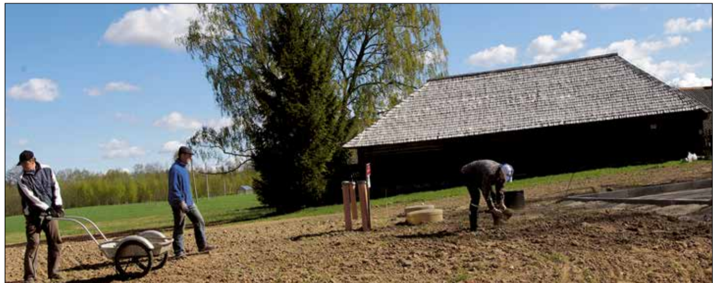
Kraammispäiv mõnõ aasta iist Teppo lõõdsamuusõumi man.