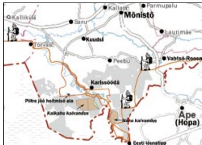
Halli maatükü omma vällä pakutu mõtsakaitsõala jaos.