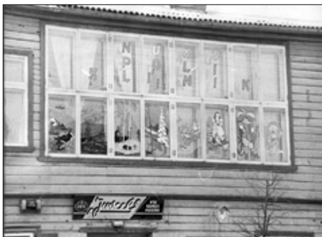
PILDI OMMA PERI VANA-VÕROMAA KULTUURIKUA MUUSÕUMIST

Pupikliinik Võrol Juveeli poodi tõsõ kõrra pääl.