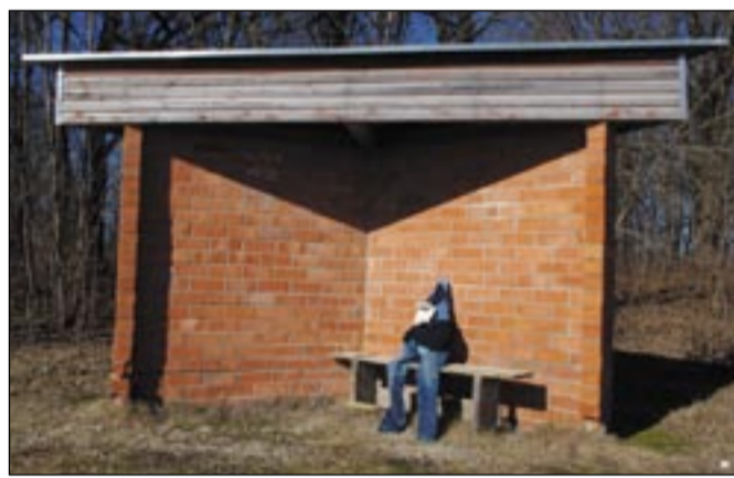
Kiäki nalähannas tekki Urvastõmõisa vahtsõ bussiuutja – inemine lätt säält kell 6.32 Võro busi pääle üte kõrra nelä kuu juosul.