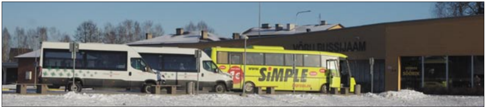
Ilma rahalda bussisõidust rohkõmb uutva mainemise säandsit bussiliine, miä passise tüülõ, kuuli ja liina asjo ajama jõudmisõs.

Tervet Eestit haardva liinivõrgu analüüsi piässi tegemä kuuntüün kas maavalitsusõ vai vahtsõ ütiistranspordikeskusõ.