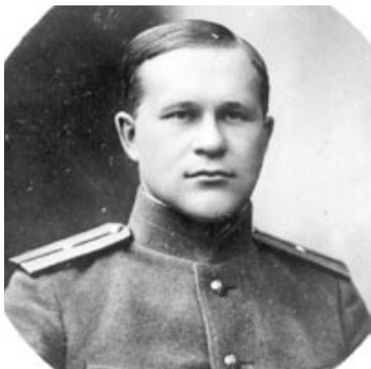
PILT OM PERI VANA-VÕROMAA KULTUURIKUA MUUSÕUMIST