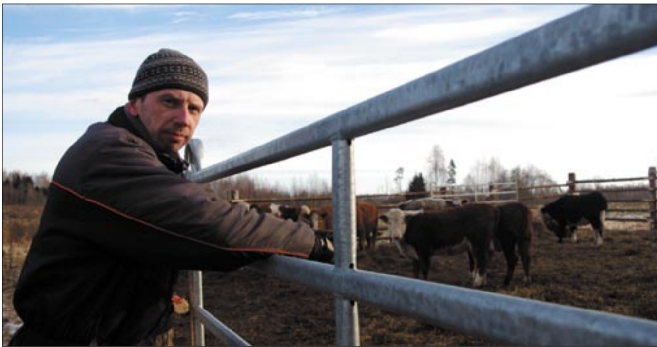
HARJU ÜLLE PILT

Keväjä taht Karli viil ütšjago eläjit mano osta, no 35 põhikafaeläjä om piir. «Olõmi ümbretsõõri kõik väiku talonigu ja ku ma võta naabrimehe käest maa är, sis olõ ma kah vacsõmb,» selet' Karli. PRIA toetuisi