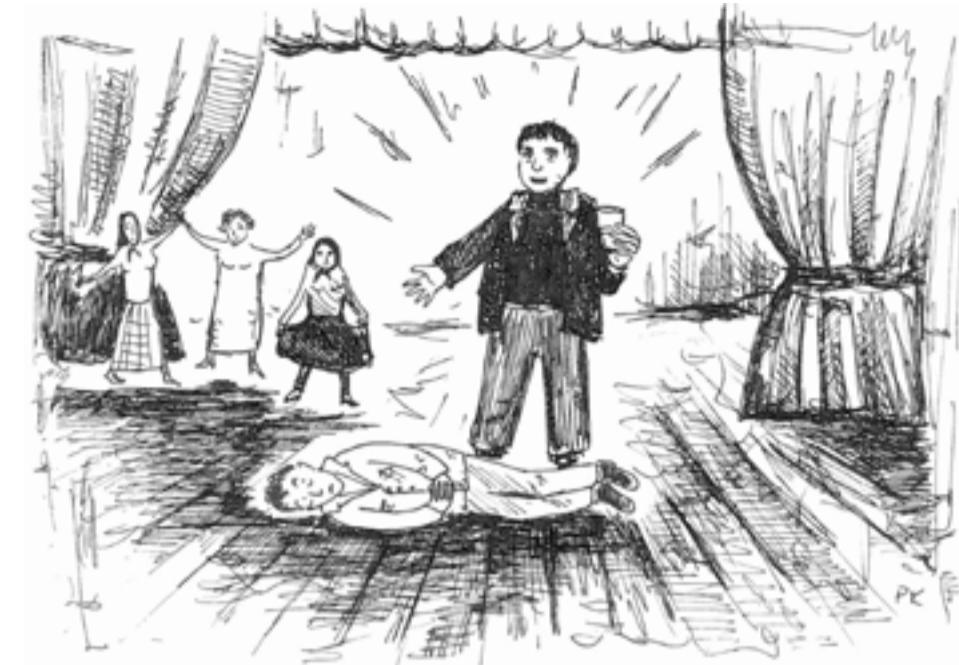
KOHA PRIIDU TSEHKENDÜS

Mõtli, et huvitav olõs hindä pääl tuu nõidus är pruuvi. Nii ma sis nõuhu jäigi. Inne küsse viil, kuis naisiga luu ommava. Nuu nakasõ jo kah päähä. Kas nuid õks või