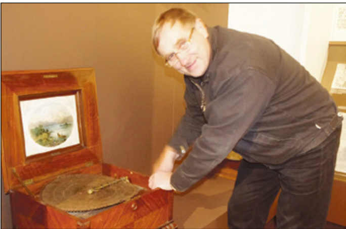
PILT UMA LEHE ARHIIVIST