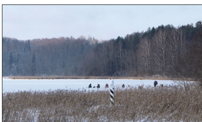
Kikkajärve Kalakõsõ karikas jäi lätläisi kätte. Minevä puulpäävä, 26. vahtsõaastakuul Eesti-Läti piirijärve Kikkajärve pääl peetü kalapüüdõmise võistlusõ «Kikkajärve kalakõnõ» võit läts seogi kõrd lätläisile. Tuu es olõ ka määnegi ime – kalla olli püüdman õnnõ viis eestläst 32 lätläse vasta. Säänest võistlust peeti joba ütsäs kõrd ja siämaailõ ommaki võistlusõ võitnu õnnõ lätläse.