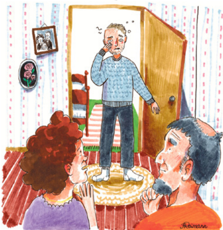
REIMANNI HILDEGARDI TSEHKENDÜS

Tädimiis pidi hummogu tüüle minemä ja ai kargu edimädsenä ala. Jõudsõ kalitorri, pand tulõ palama ja suur oll imehtämäne, ku nägi, et latsitarõh maka kiäki. Poja eläse mõlõmba pääliina lähküh. Lätis sis tädi mano ja üteli, et väiga imelik, poig om üüse kodo tulnu. Tädi ai kah hinnäst sängüst vällä ja arvas, et tuu ei saa kuigi nii olla. Säanest asja es olõ viil kunagi olnu, et poja nii kodo tull, et tuust inne juttu es ti, ja ku tulliva, sis iks kõgõ perrega. Jala otsõva sängüveere alt ussõ, a silmi iih virvend