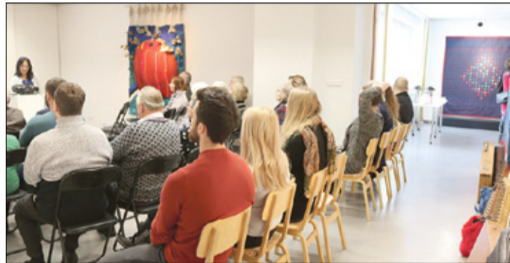
Kandlõraamadu näütamine Võrol.