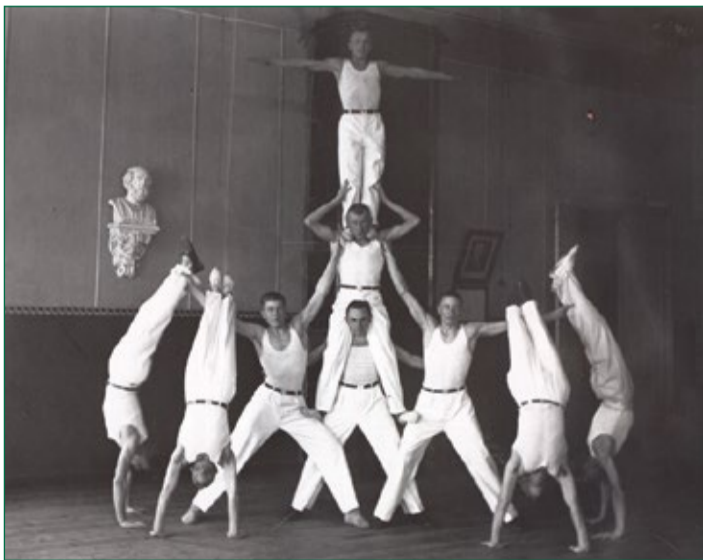
PILT OM PERI VANA-VÖROMAA KULTUURIKUA MUUSÕUMIST