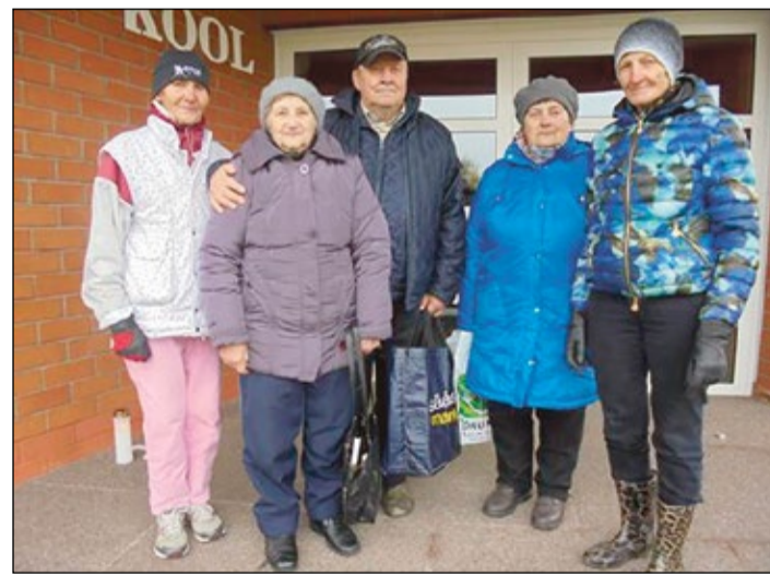
LÜÜTSEPÄ EDA PILT

Kikka Aino tull umal aol Krabi kuuli hoobis arvõammõtnigus, ildampa sai tüütärlatsi spordioppajas, opaš matõmaatikat kah. «Inne võistluisi oll vajja suusõ tõrvada ja tuud sai tetä ahopaistõl. A kütimi aho lahki. Ei tiä, mille, a parandi