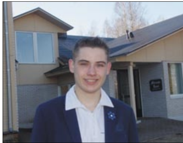
HARJU ÜLLE PILT

Oi, noorõ omma joba täveste vahtsõt muudu! Vahepääl om nii, et ku ma noorilõ määndsegi mõttõ vällä käü, sõs nä tuud tetä ei taha. Tahtva õks tetä ummamuudu ja asju,