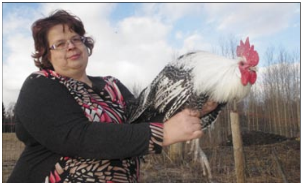
HARJU ÜLLE PILT

«Hani kõndva muidu jo iks väläh.» üteli Ülo. «Aid om külh olõmah, no sis piät näile haina ette niitmä, selle et värskit haina nä väega tahtva. No teedüst om kah veidü, näütüses, kas tsirgugripi vöi värski hainaga