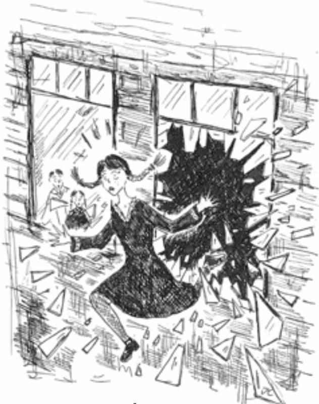
KOHA PRIIDU TSEHKENDÜS

Mul oll' tuukõrd sääne rummal kommõ, et jõudsõ kuuli iks viimätsel minutil inne tunnõ.