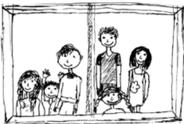
Joonis SAARÕ HIPP

Võrokiilse multika', kildamängo' ja memoriini' latsilõ: wi.werro.ee/lastekas/