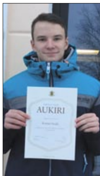
SILLAMÄE ÜLLE PILT

Ülle avifki Kermol taad tüüd võro kiilde panda. «Juriidilinõ