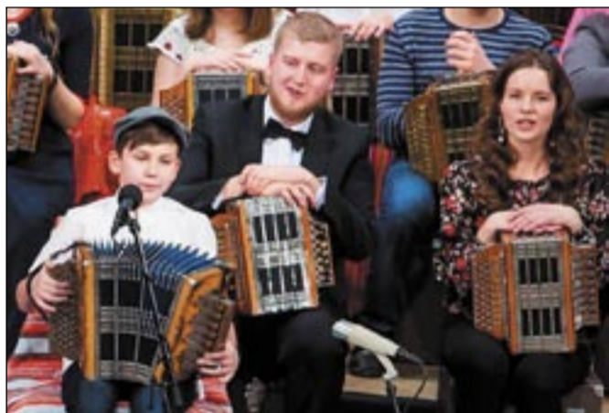
SEMMI RIHO PILT

Kuundorkestri sai küll õnnõ kolm luku tetä ja olf nätä, et pillimehe tahtnu viil mängi, ku ei olõs pidänü saatõ lõpuga pito är lõpõtama.