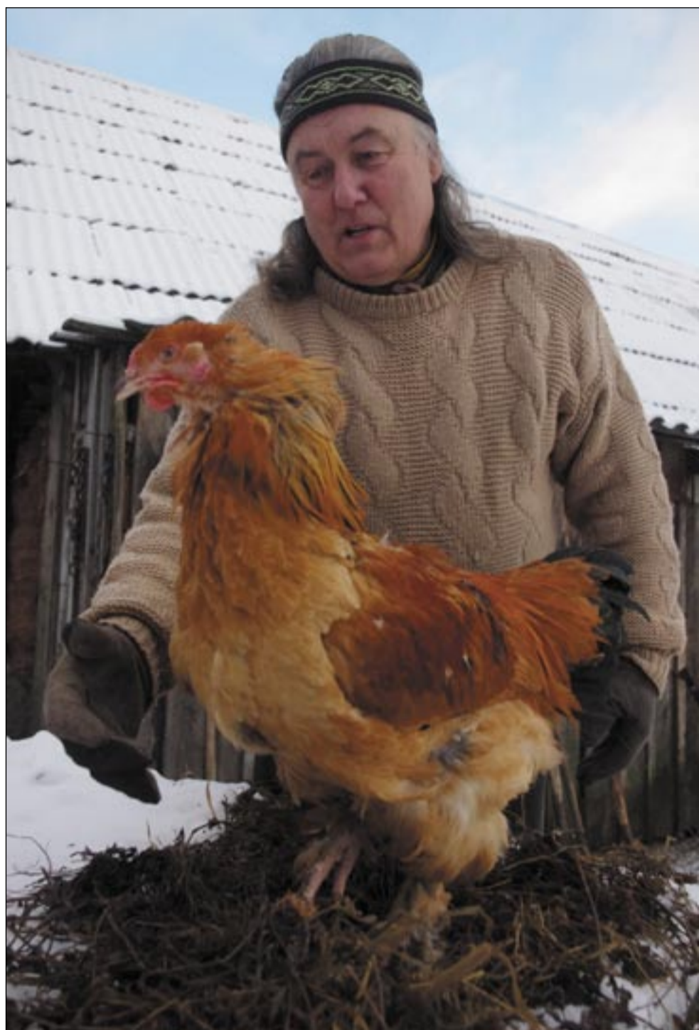
HARJU ÜLLE PILDIT

Om määnegi kikas lauda valitsõja olnu? «Noo, kõik aig teküs määnegi valitsõja,» muhelõs Pulk. «Kolhoosiaigu peeti valgit kanno paar tuhat ütten huunõn seen. Ku säääl kikka naksi kaklõma, sis nä kakli tiiru pääle ütstõsõga. Ku säääl tulli valitsõja, sis noil olf hari hoobis tummõmb ku tõisil. Arvada olf midägi hemoglobiinisaldusõga veren. Tollõs aos, ku tõsõ surmani väsinü olli, olf näil iks viil määnegi jõud ja tollõga nä saivaki valitsõjas. Nuu valitsõja omma pallo parõmba loomuga ku alamba: tiidvä, et näile kiäki vasta ei saa ja näil ei olõ vaia tõisi retsi. A ku mõni alamb valitsõjas saa, tuust ei tulõ midägi väällä! Vähämbält kikkil. A mis inemisega om, noid katsit ma tennü ei olõ!»