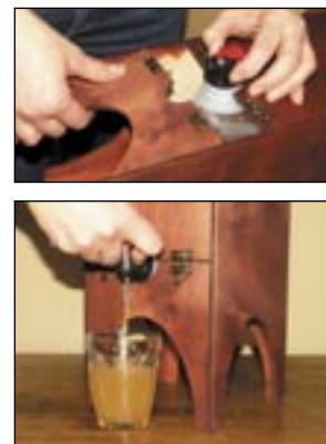
Nii käü mahlakast vällalõ ja mahl kasti.