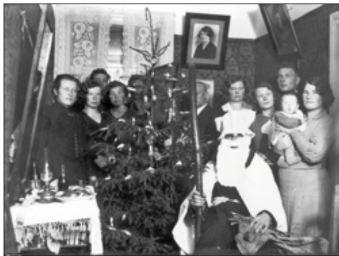
PILT OM PERI VANA-VÕROMAA KULTUURIKUA MUUSÕUMIST