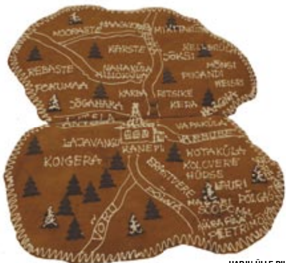
HARJU ÜLLE PILT