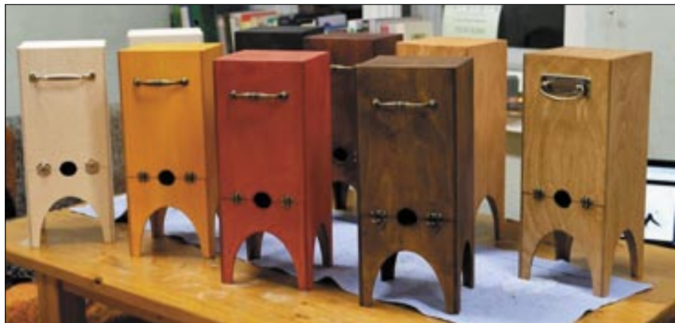
Parijõgi Ahti edimäde ubinamahlapakihõitja lätõ kaubas nigu lämmä saia.

«Kõgõpäält – kasti piät saama panda iks kesk lauda,» seletõ tä. «Mõtli, et kuis mahlakoti