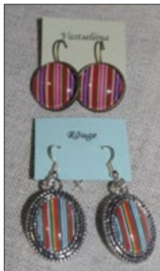
Vahtsonõ kodokandiperäne kingitüs – uma kihlkunna prundstriibolõdise kõrvarõnga.

10.12. tulõ suur jõululaat Põlva kultuuri- ja huvikeskusõn. 11.12. peetäs jõuluturgu Moosten ja Valgjärvel.