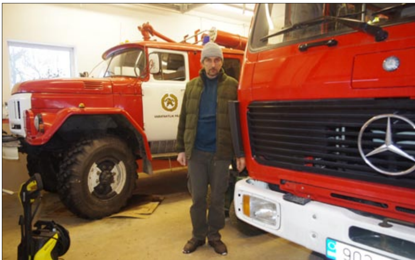
Pruti Väle om küll pia kats miitret pikk miis, no katõ võimsa pästemassina vaihõl tuu vällä ei paistu.

Minevä nädäli olgfi sääne tsõõr ja celektriharidusõga Väle hiitü ütlen «kolhoosimaja» kortõrin iks väega är. «Lämmäviiboiler olf pantu õkva vanni kotsilõ, vana juhe tull õkva üleväst alla ja küündü poolõhuisi vanni sisse,» kõnõlõ tä. «Tsähvi saamisõ võimalus olf iks väega suur, no inemine esi es tunnõ määnestki ohto. Tei sis väega kõrraligult seletüstüüd, kuis inemine