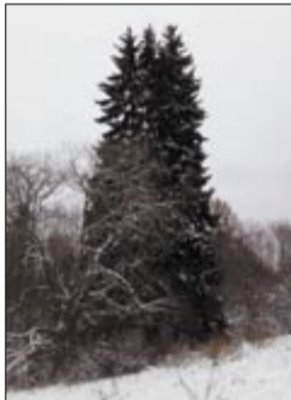
JOONASE JUHO PILDIT