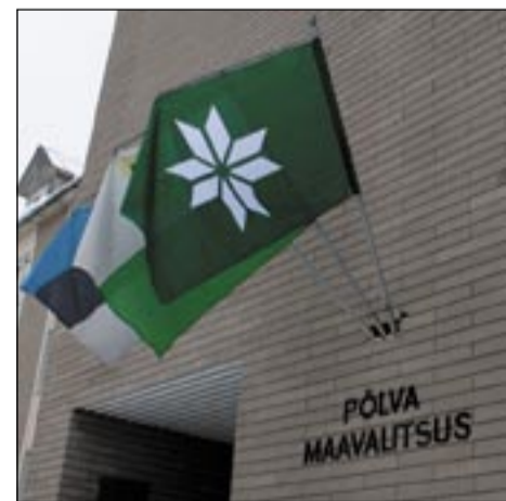
PÕLVA MAAVALITSUSÕ PILDIT