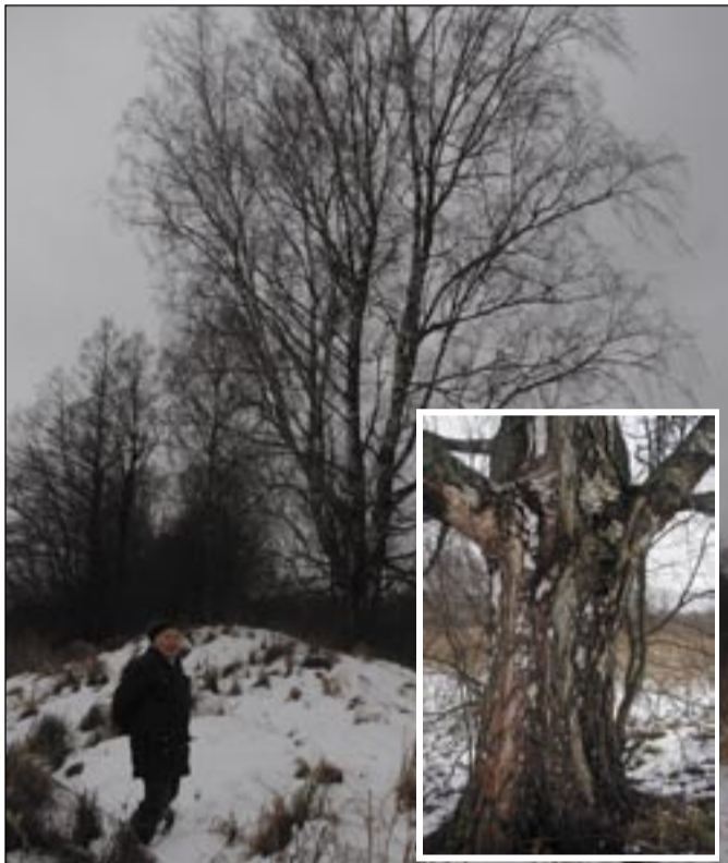
Leisi Öie näüdäs Listaku külän jämme kõivu.