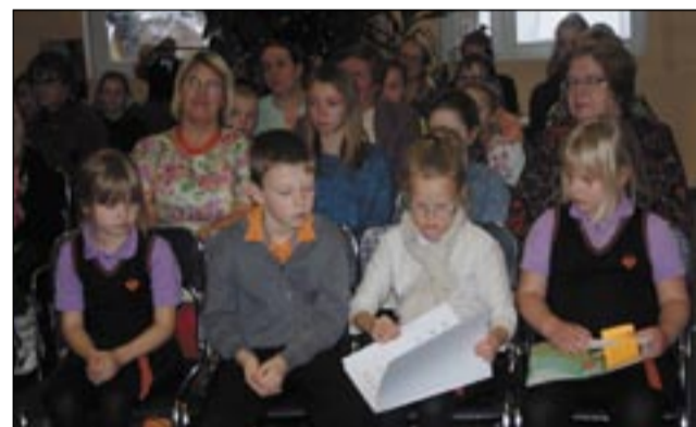
HARJU ÜLLE PILDIT

Võrokeelitside videoklipikeisi võistlusõ «Kae sõs!»