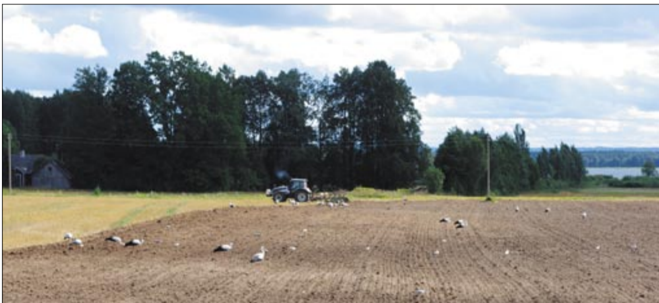
HARJU ÜLLE PILT

No nii Oidermaa ku ka Antsla kandi talomiis