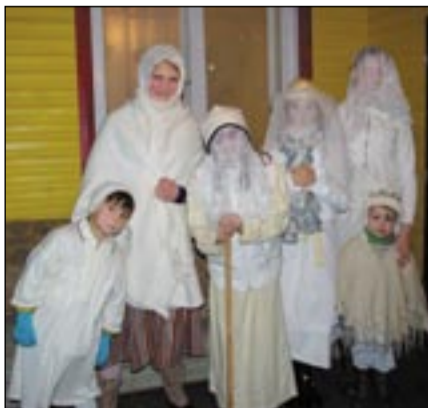
SAARÕ EVARI PILT

Midä ütles? imä ja esä latsilõ? B3 A4 C1 A1 C6 A1 C2 D2 A5 A4 B2 C2 C1 D2 B5 D4 A6 A6 B2 A1 B3 C2 !