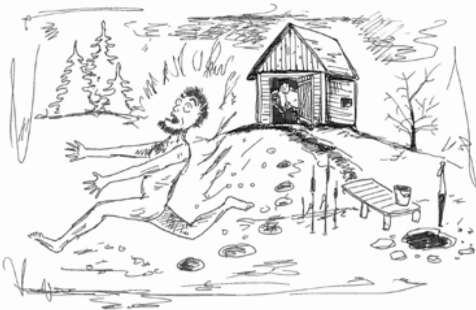
KOHA PRIIDU TSEHKENDÜS

Oi sa mu jutt, miis lätš nigu ullis! Juusk saina pite