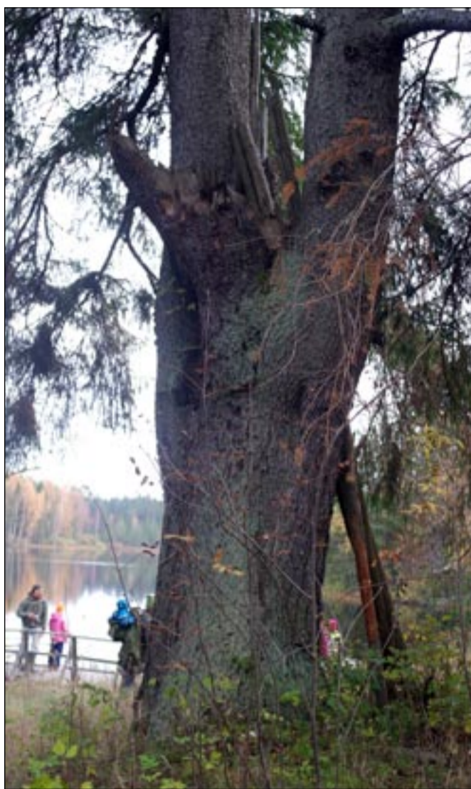
KÄRGENBERGI HELINA PILT

Toimõndusõlt: ku tiiät uman kodokandin mõnt jämmet, pikkä vai ummamuudu kujoga puud, anna tuust Umalõ Lehele teedä.