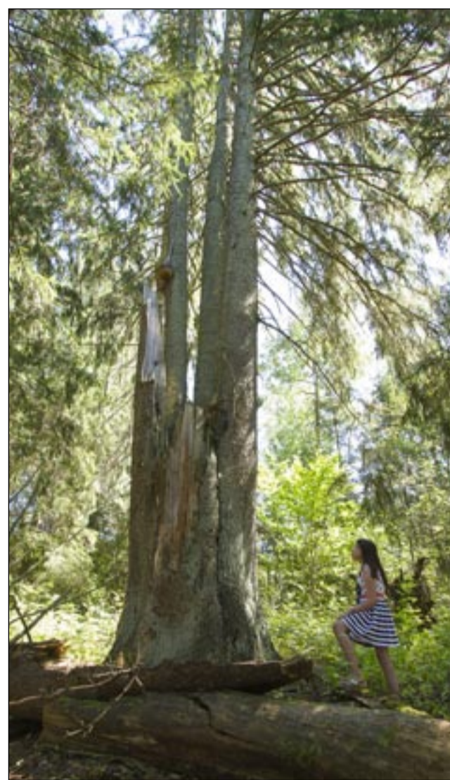
MUUSIKUSÕ INGMARI PILT

Eesti jämmemb kuus nr 2 kususõ Hүүdre järve veeren.