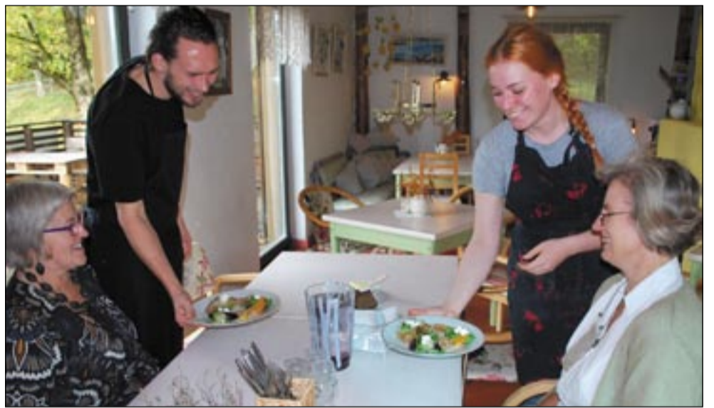
MOPPELI KADRI PILDID

Uma Meki nädälit kõrraldas Võromaa arõnguagentuur kuuntüin Võromaa turismiliiduga.