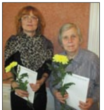
SÄINASTI TEEMARI PILT