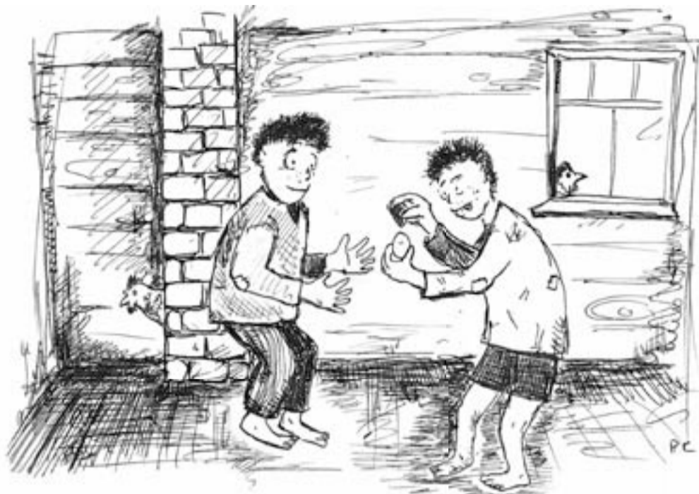
KOHA PRIIDU TSEHKENDÜS

Paar päivä ildampa löüd-simi velega, õt sinna kanapessä om üts muna tervenä järke jäänü. Veli arvas, õt