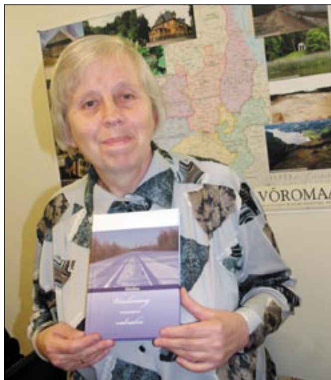
HARJU ÜLLE PILT

Hänniläse vahtõn raamatun om 12 tävvelist jako. Egäüts näist pututas mõnt hingekiilt. Näütüses jaon «Pilk tõistõ hengeliiste ilma» umma luulõtusõ unõnäohobõsõst, samblist, noorõ tsirgu surmast, mälestüi-