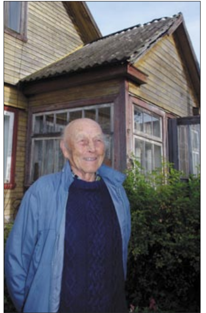
HARJU ÜLLE PILT

«Ku Koola puulsaarõ pääle puuriti ilmadusükäv kaiv, sõite kavvaaignõ täppis-teaduste toimetaja Veskimäc Rein õkva toda kaema,» selef tä. «Ku olf NSV Liidu 50. aastapäiv (1972), sis teime ringreisi müüdä liiduvaba-riike. Egän numbrin olf lugu. Tuu seeriä iist saime eski aokirändüspreemiä.»