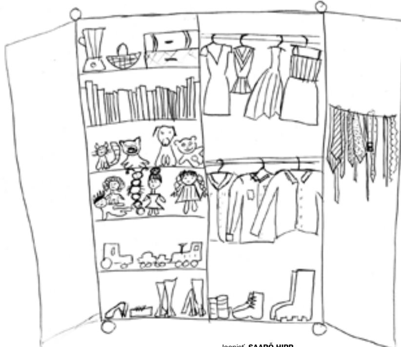
Joonist SAARÕ HIPPI

Otsi' vällä värmiplaiädsi' vai vildiga'. Otsi' pildi päält üles ja värmi' är', miä om tahet!