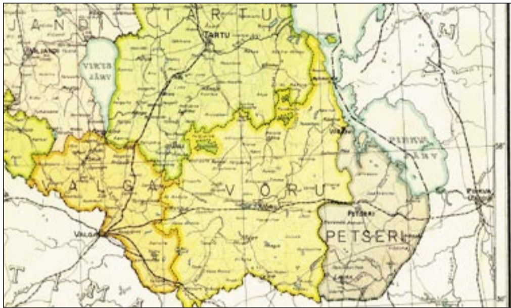
Võro maakund 1925: Harglõ ja Karula omma vahtsõ Valga maakunna jaos är võetu, no suurõmb jago Vanas-Võromaaš jääs ütte viil aastakümmis. Setomaa om Petseri maakunnan.

Haldusreformi tegemise mantlunu riigi käest võimalikult pallo tukõ saia, a sundliitmise valinu vald toetusrahha ei saa. Kultuuriipiiri omma muidoki tähtsäs, a saa-i olla ainukõnõ argument. Mehikuurma om kah kõgõ Vanal-Võromaal olnu ja tulõ sinnä tagasi – om kõüdetü Rāpinā kihlkunnakeskusega. No Orava vallal om silmakirjalik kõnõlda kihlkunnast, ku tsiht om hoobis Võro liin. Ma tugõnu katõ käega Orava valla ütteminekit Võro maakunna naabrõtega, ku nä kamba pääl 5000 vai viil parõmb, 11 000 elānikku kokko saanu.