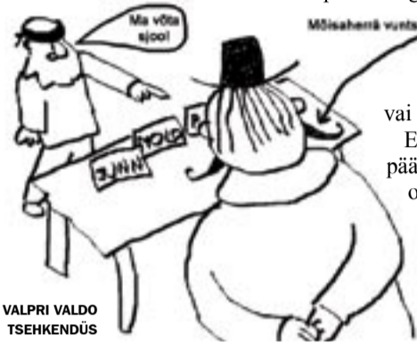
VALPRI VALDO TSEHKENDÜS