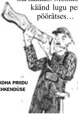
KOHA PRIIDU TSEHKENDÜSE