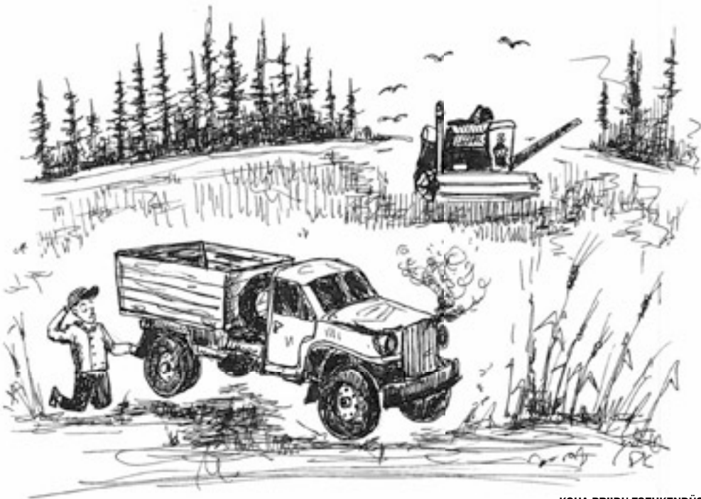
KOHA PRIIDU TSEHKENDÜS

massinaga jälki om? Mootorin vesi tüküs väega lämmäs minemä. Ei mõista inämp, kõkkõ om proovitu,» vinüf Kusti umma juttu.