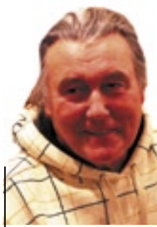
PULGA JAAN, talu- ja luudusõmiis

Poodi man, teedäki, ollõ naise nigu alati ja noidõ tõlgõndus asja kotsilõ ollõ sääne, et