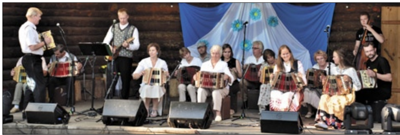
Kikka Karla nimelisel lõõdsapääväl tõmbsi lõõtsa nii noorõ ku vanõmba pillimängjä.