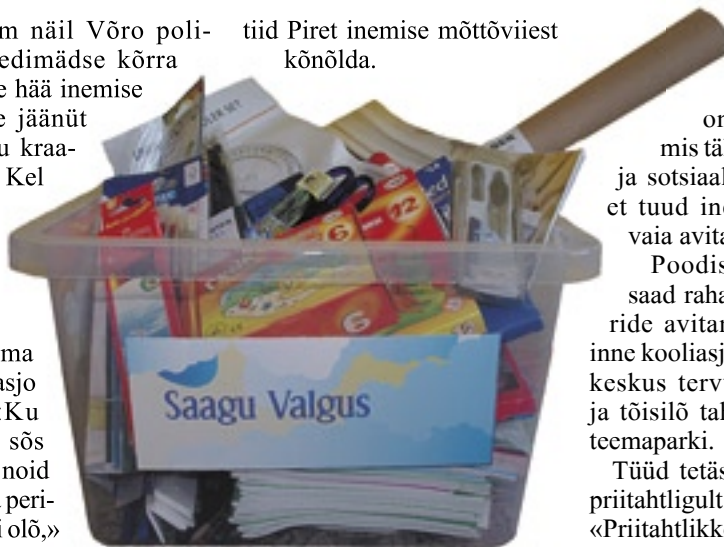
Sändse kasti saava kingis 20 Võromaa kuuli.

Massulda saa õnnõ sõs, ku inemisõl om täpsele teedä, mis täl õkva puudu om, ja sotsiaaltütõtjä kinnitäs, et tuud inemist om tõtõst vaia avita.