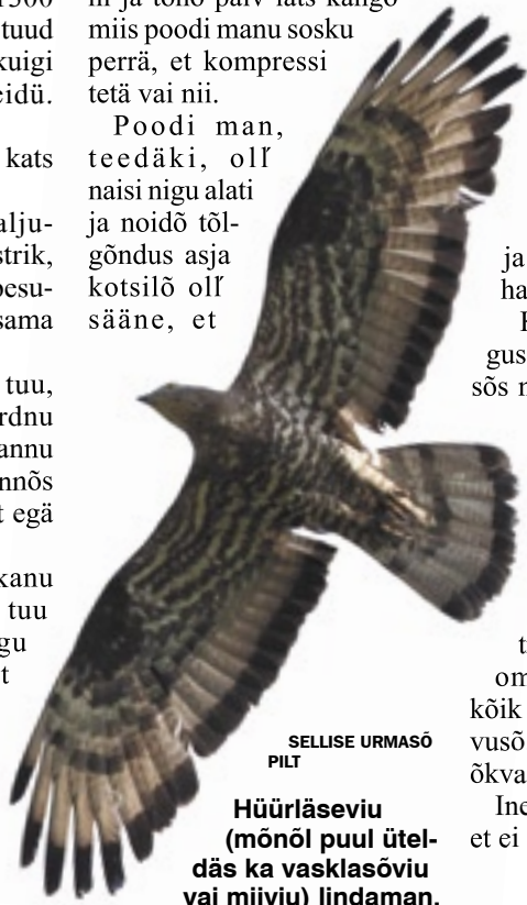
SELLISE URMASÕ PILT